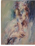
21 Ohne Titel, ohne Jahr, Öl auf Leinwand, 140 x 100 cm