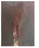
23 Ohne Titel, ohne Jahr, Öl auf Papier auf Holz, 133 x 100 cm