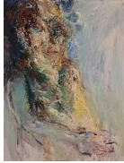
20 Ohne Titel, ohne Jahr, Öl auf Leinwand, 140 x 100 cm