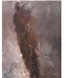
24 Ohne Titel, ohne Jahr, Öl auf Papier auf Holz, 130 x 96,5 cm