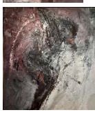
25 Ohne Titel, ohne Jahr, Öl auf Leinwand, 180 x 159 cm