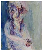
19 Selbst, ca. 1983/84, Öl auf Leinwand, 120 x 100 cm

Weitere Informationen unter: www.karl-ludwig-lange.de