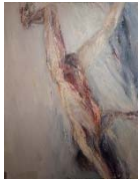
22 Ohne Titel, ohne Jahr, Öl auf Leinwand, 140 x 100 cm