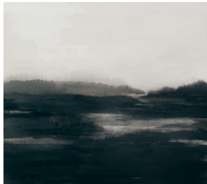
Öl auf Leinwand, 160 x 180 cm