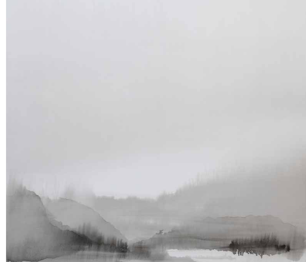
Triptychon für Herford St. Johannis